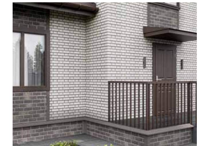
ЦОКОЛЬНЫЙ КИРПИЧ, перуанский