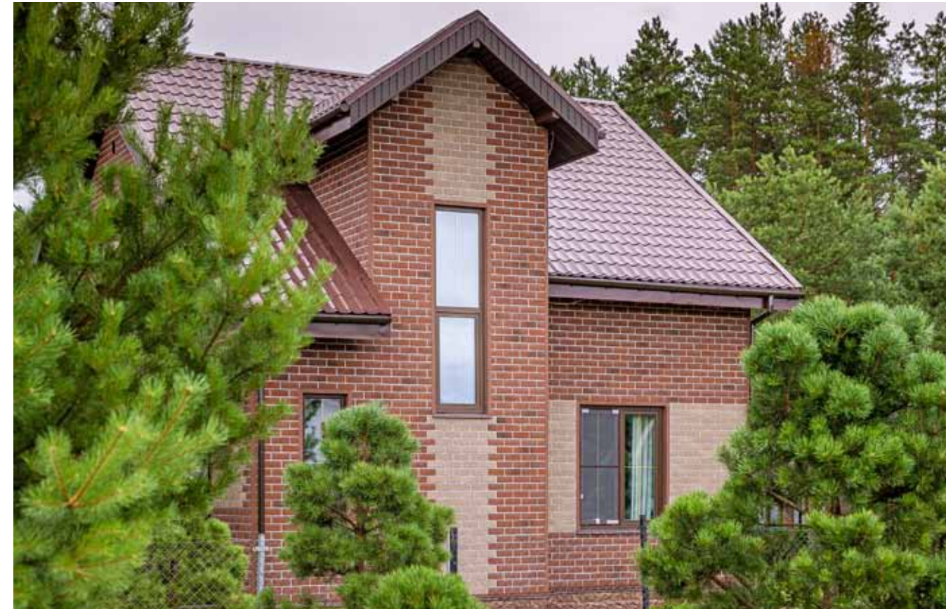
КИРПИЧ, античный и красный