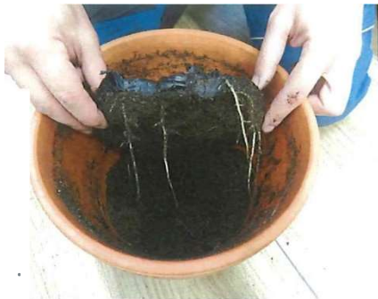
Фото № 2 и 3- Корни не проникли в мембрану Planter Eco