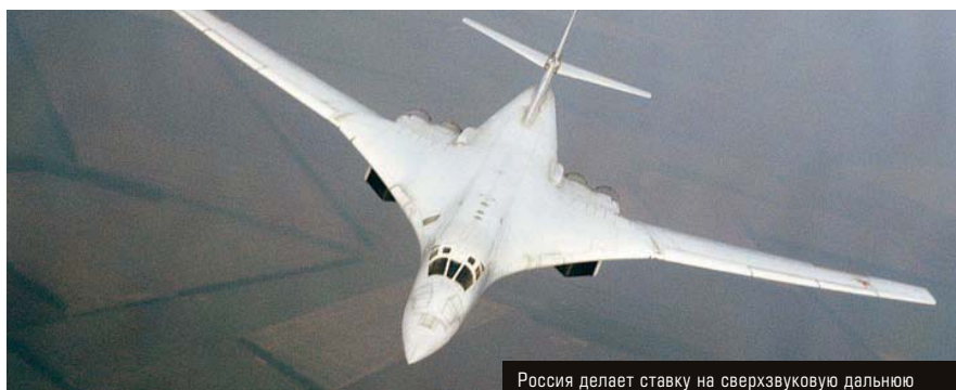
Россия делает ставку на сверхзвуковую дальнюю авиацию

З амминистра обороны Юрий Борисов подписал контракт с главой ОАК Юрием Слюсарем на поставку нашему военному ведомству десяти стратегических бомбардировщиков Ту-160М2 «Белый лебедь» на общую сумму 160 млрд рублей. Это произошло сразу же после демонстрационного полета только что выпущенной модернизированной версии Ту-160, которую показали в небе над Казанью Владимиру Путину .